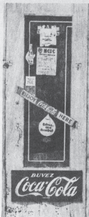
La gravure «Stone Front Door», de Chery Holmes.

Il est rare qu'une exposition de jeunes photographes québécois dégage tant de maîtrise technique et stylistique que celle de Groulx et de Decary. Sûrs de leurs moyens, sans fioritures, ces photographes s'affirment avec une série de clichés couleurs dont la thématique est complémentaire. Un travail plus qu'honnête, technique-